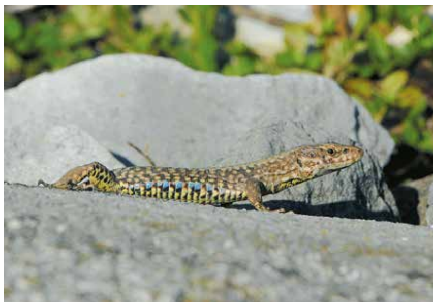
Die Mauereidechse hat sich vom Süden her entlang der Bahnlinien in unsere Region ausgebreitet und fühlt sich in den warmen, trockenen Mauern wohl.