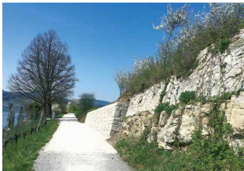
Die neuen Mauern am Chorherrenweg bieten für die Mauereidechsen einen idealen Lebensraum.

Wenige Schritte von Ihrer Haustür entfernt lassen sich Wildtiere am Boden, im Wasser und in der Luft beobachten. Die Natur im Siedlungsraum ist vielfältig und es gibt einiges zu entdecken.