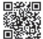
Illustration: Peti Wiskemann

Informationen finden Sie in unserem Veranstaltungskalender oder auf www.maennedorf.ch/anlaesse